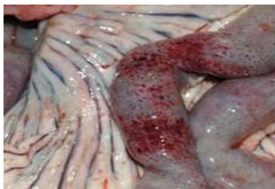
Υπεραιμία του βλεννογόνου του εντέρου.

Η ΕΠΙΒΕΒΑΙΩΣΗ ΤΟΥ ΝΟΣΗΜΑΤΟΣ ΓΙΝΕΤΑΙ ΜΟΝΟ ΕΡΓΑΣΤΗΡΙΑΚΑ!!