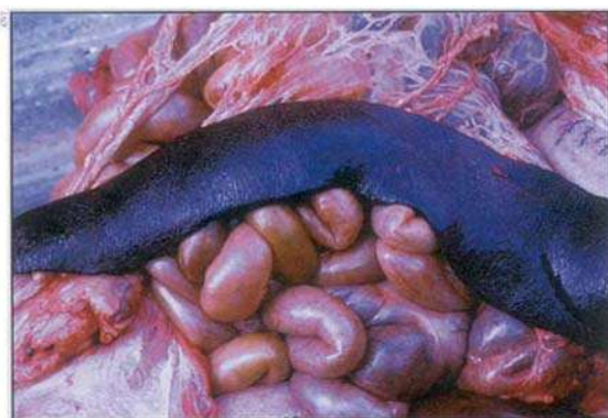
Σπλήνας διογκωμένος και σκουρόχρωμος.